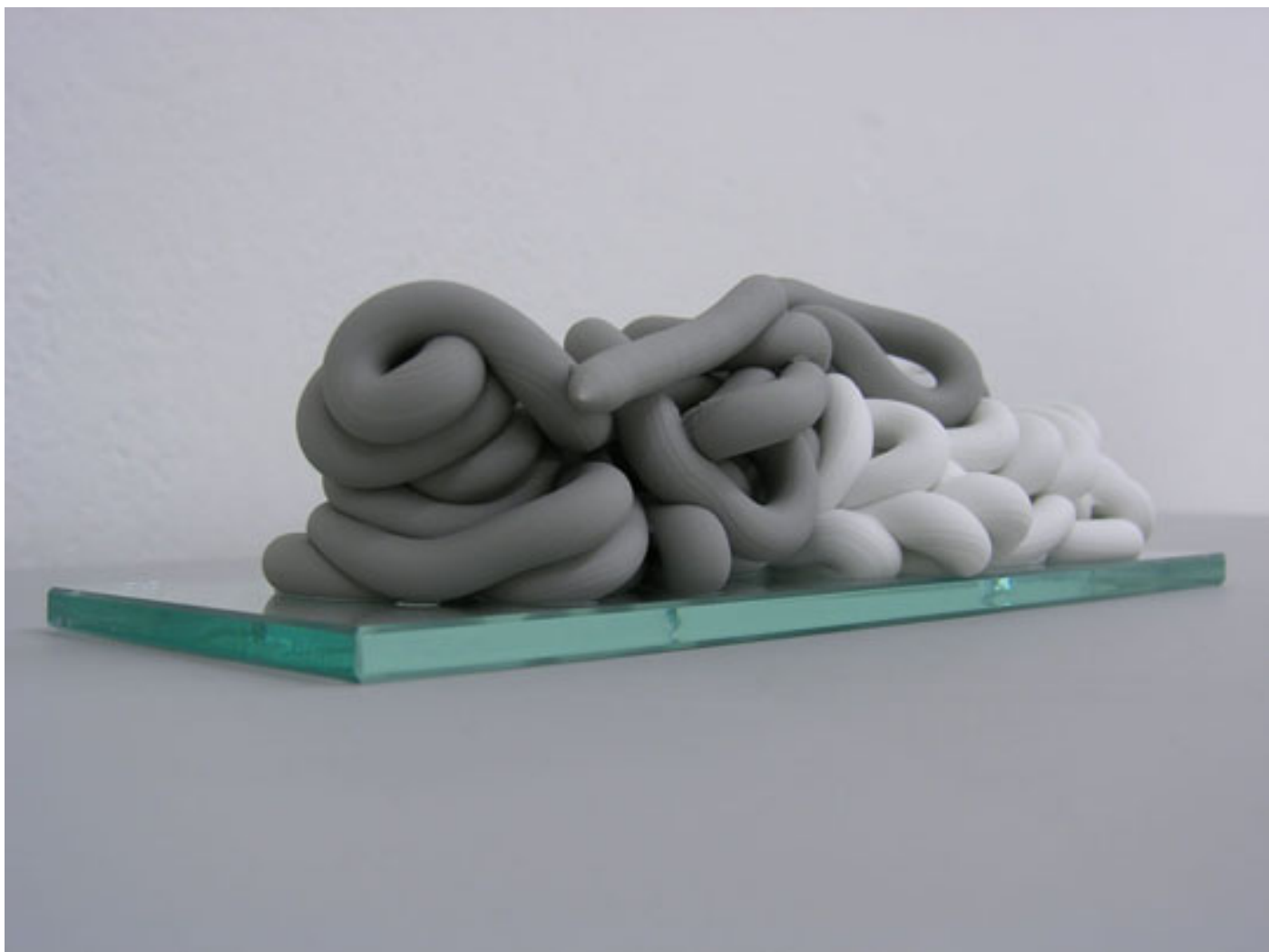
Grau neben Weiß , 2013 44 x 14 x 12 cm