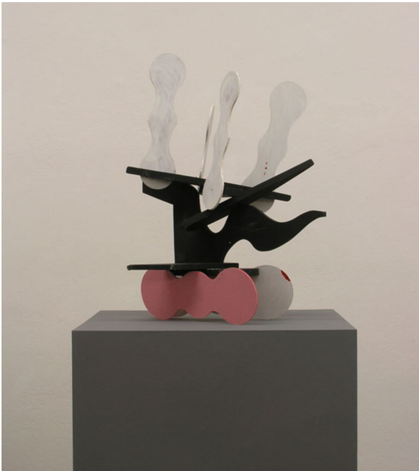
Turm 2 , 2011 Höhe 54 cm