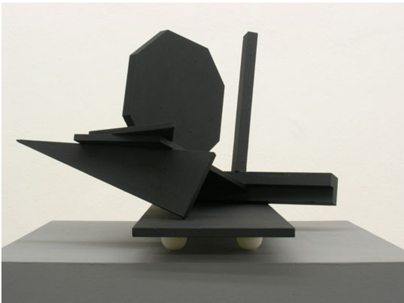
Zick-Zack , 2012 57 x 41 x 62 cm