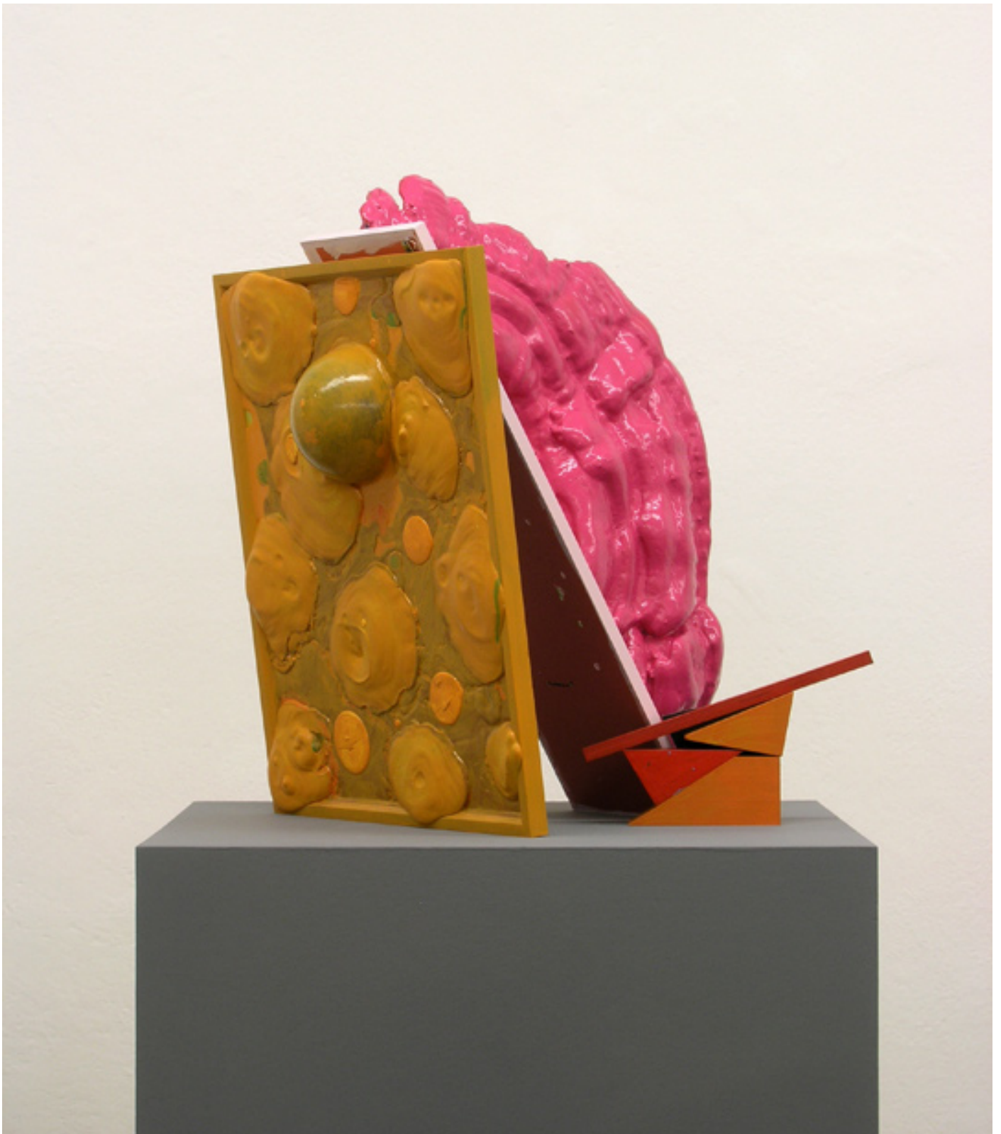
Schanze , 2012 72 x 70 x 60 cm