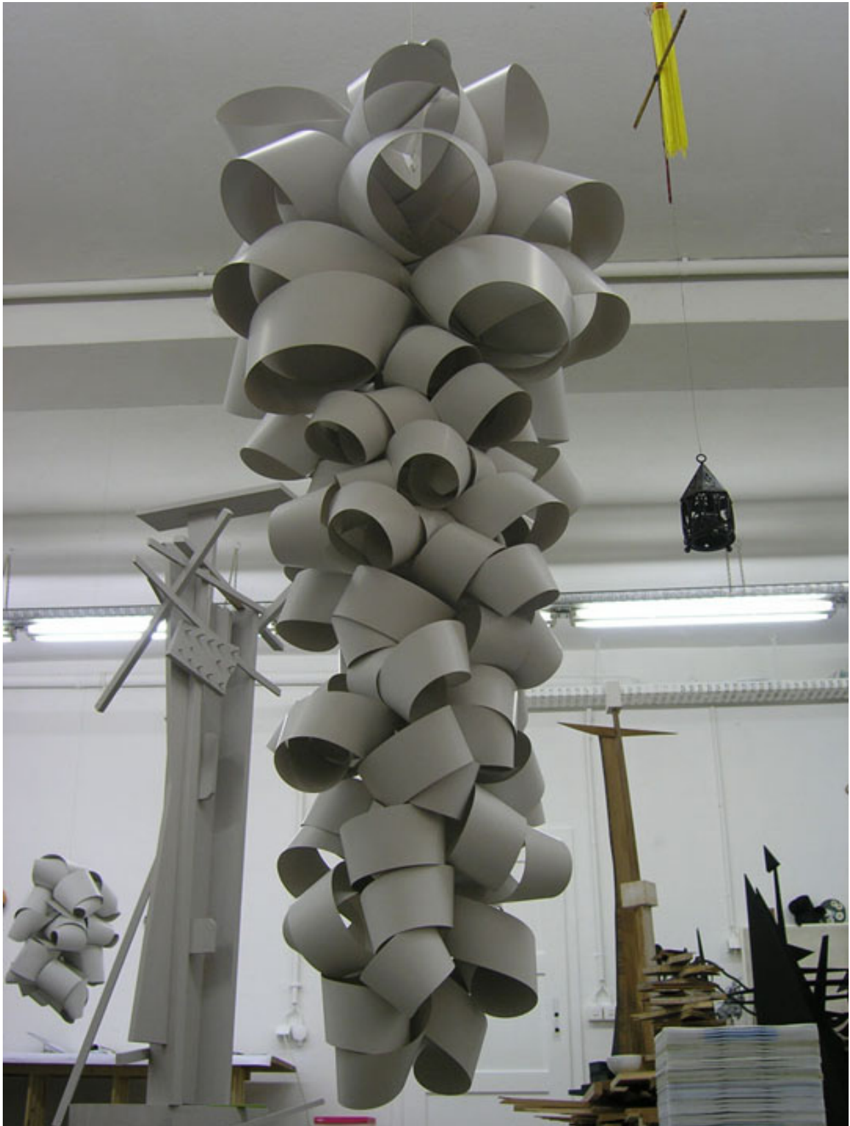
Meteo. 2012 Höhe 163 cm