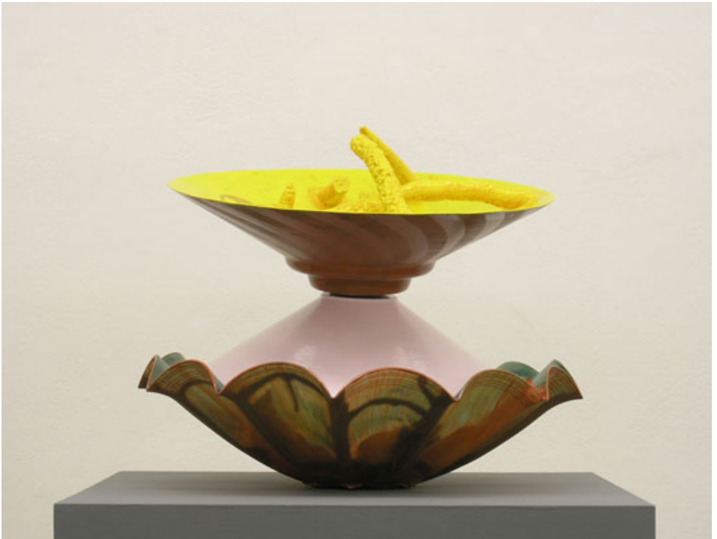
Skulptur 037 , 2011 53 x 57 x 53 cm