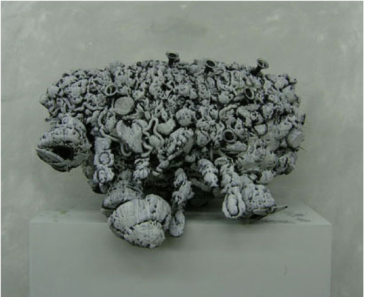
Meteo 2 , 2013 16 x 73 x 80 cm