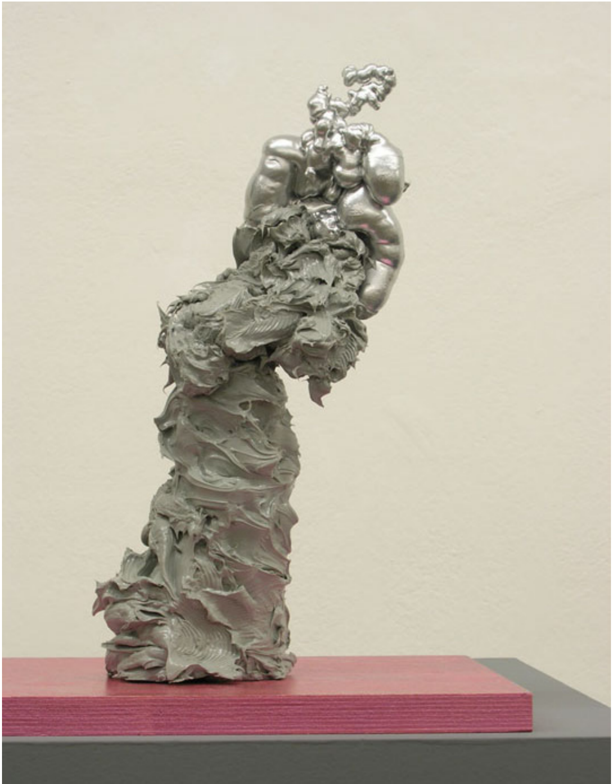
Skulptur 08. 2012 Höhe 43 cm