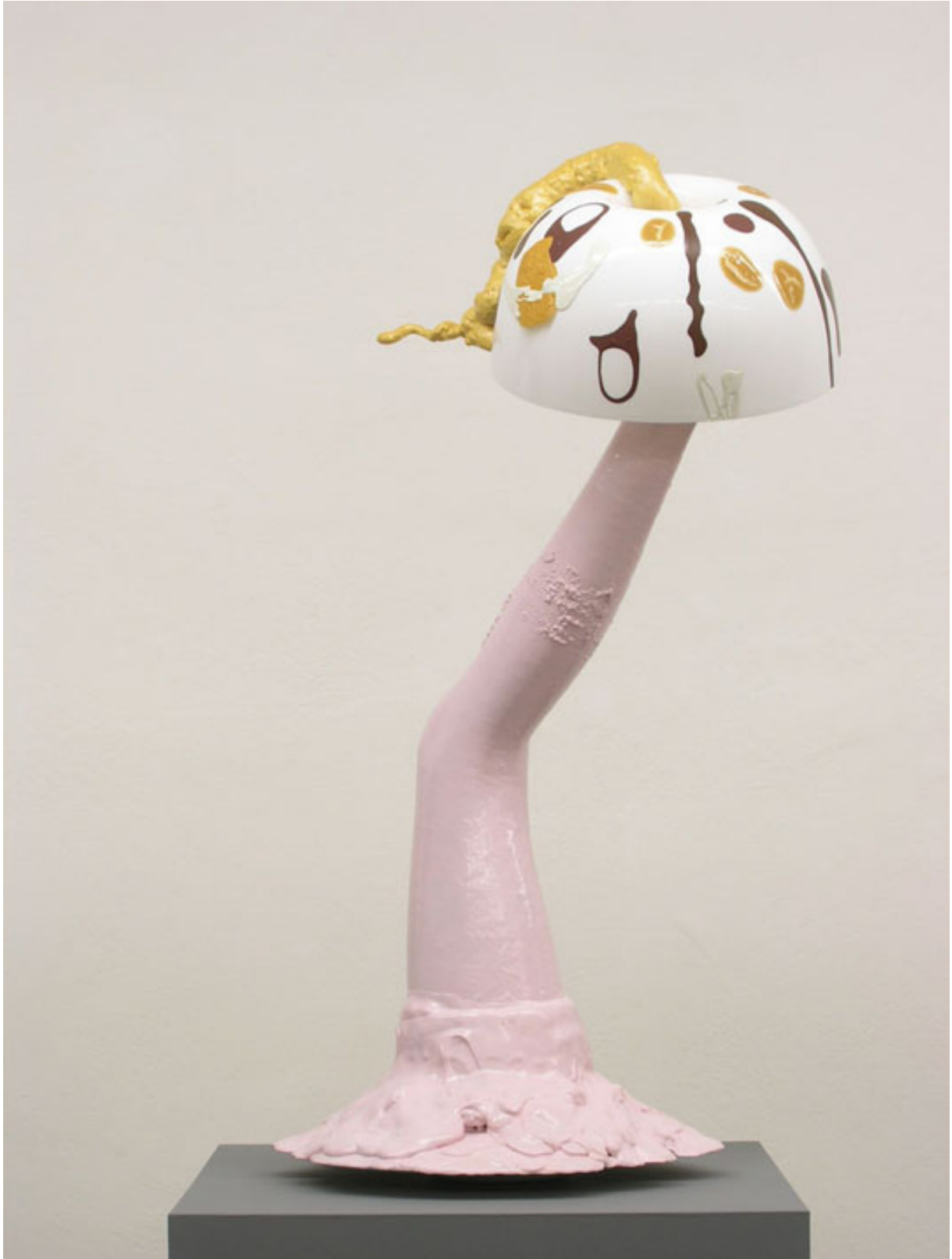
Skulptur 025 , 2012 Höhe 108 cm